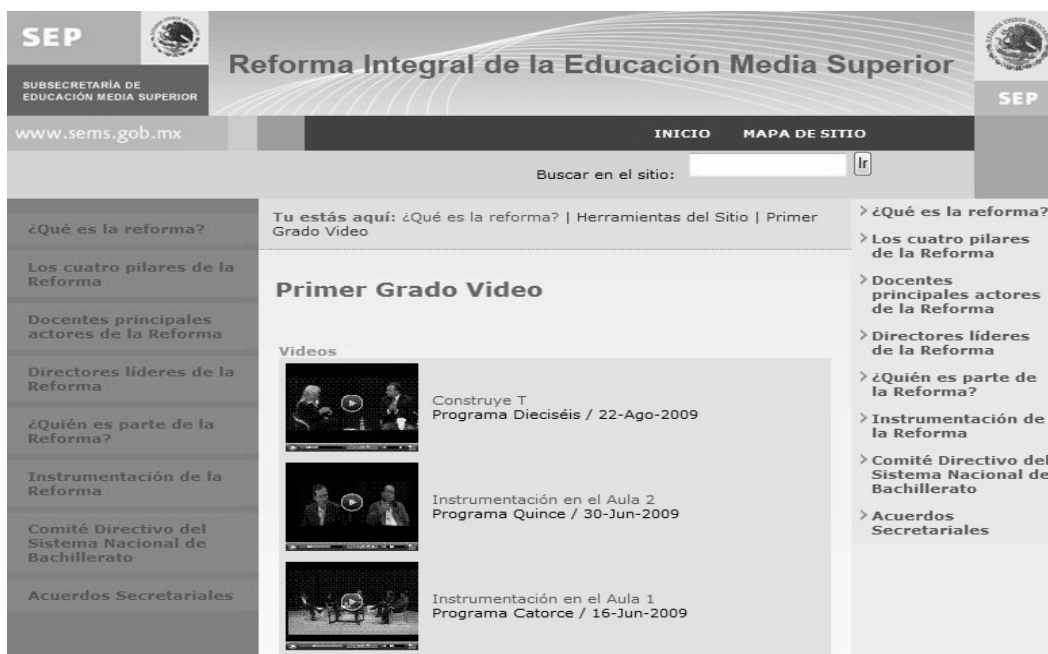
Figura 3. Acceso a los programas de televisión de Primer Grado, estrategia de difusión de la RIEMS.

La educación media superior en México ha sido hasta hoy mayoritariamente presencial, tanto en el modo de ofrecimiento a los estudiantes como en el modo en que los docentes han sido formados. Por tal motivo, en el contexto nacional, la formación de docentes bajo una modalidad mixta es una estrategia innovadora, sin precedentes.